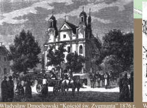
Władysław Dmochowski „Kościół św. Zygmunta” 1876 r.