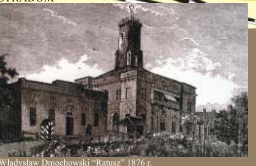
Władysław Dmochowski „Ratusz” 1876 r.