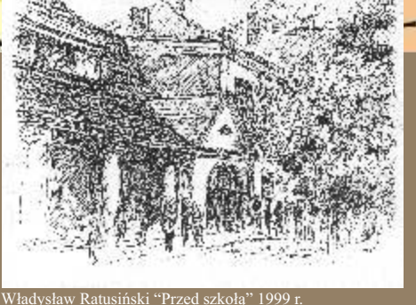
Władysław Ratusiński „Przed szkołą” 1999 r.