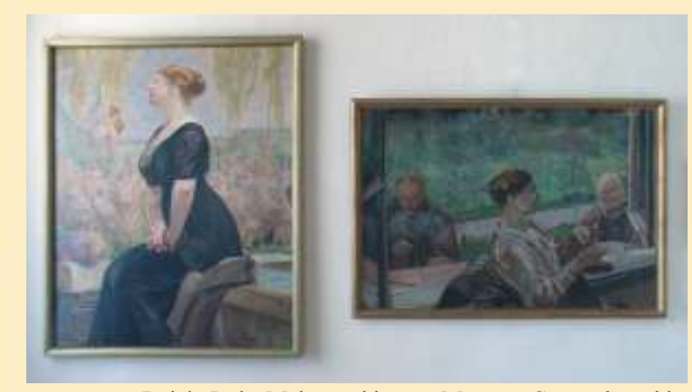
Dziela Jacka Malczewskiego w Muzeum Częstochowskim

Muzeum Archidiecezji Częstochowskiej (A/B-6) Zbiory muzeum stanowią zabytki sztuki sakralnej z Częstochowy i okolic powstałe w różnym czasie, mające wartość nie tylko artystyczną, ale także historyczną i kulturową. Wśród rzeźb wyróżnić należy Matkę Bożą z Dzieciątkiem z ok. 1430 r., figury Chrystusa czy postacie świętych takie jak: św. Marcin ze Mstowa z ok. 1500 r., czy św. Joachim z połowy XVIII w. Kompozycje malarskie to w większości obrazy przedstawiające świętych bliskich polskiej duchowości religijnej, m.in. św. Anne, św. Antoniego Padewskiego, św. Rocha i św. Sebastiana, św. Pawła Pustelnika oraz sceny z życia Chrystusa i wizerunki Matki Bożej. Ciekawą częścią zbiorów są numizmaty oraz medale wydawane z okazji różnych wydarzeń kościelnych i uroczystości religijnych - stanowiące swoistą historię Kościoła. ul. św. Barbary 41, tel. +48 34/ 368 33 61 czynne: wtorek - sobota 9.00 - 13.00